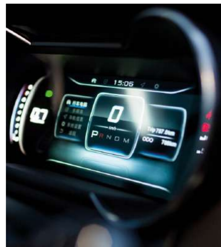
DIGITAL COCKPIT DE 12.3"