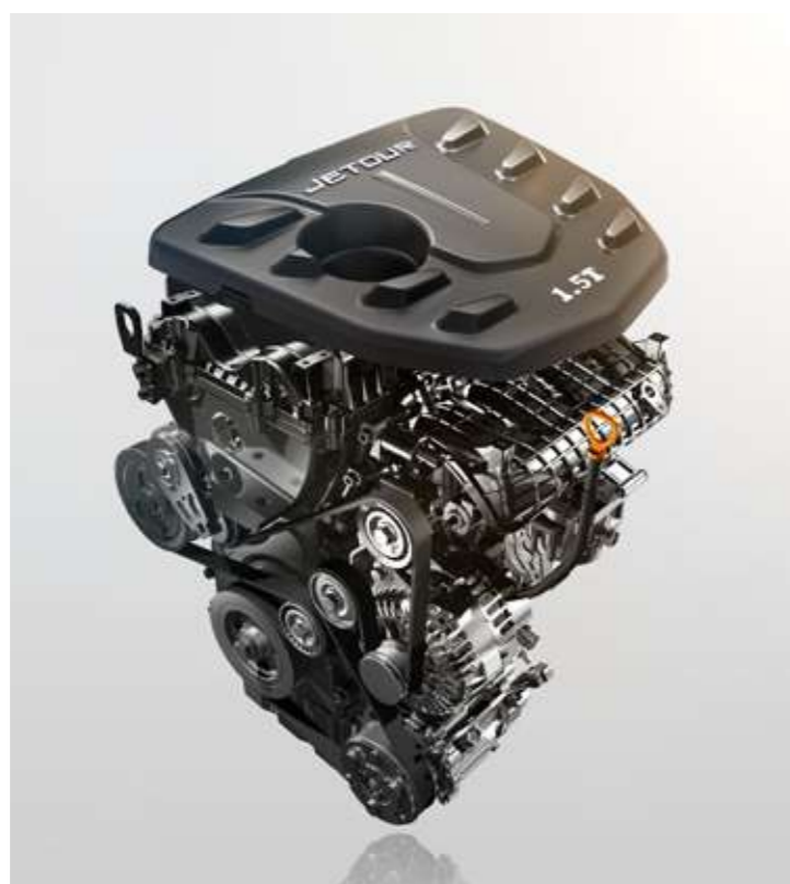
MOTOR 1.5 TURBO

Pon a prueba la resistencia de esta gran SUV