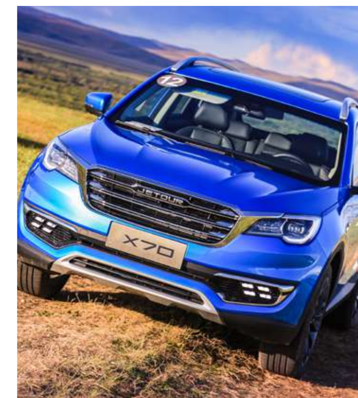
ABS + BAS + EBD + TCS + HSA + Autohold