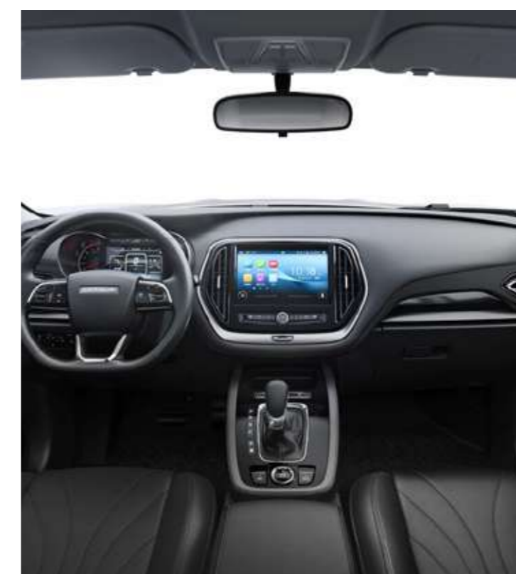
PANTALLA DE INFOENTRETENIMIENTO DE 10"