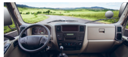
INTERIOR DE LUJO