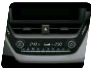
Climatizador dual y calefacción