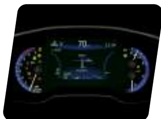
Panel multi-información De 7" TFT (Thin Film Transistor)