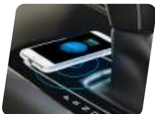
Cargador inalámbrico para smartphones