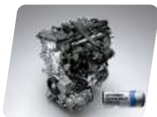
Tecnología híbrida: Potencia máxima total de 167.7 hp