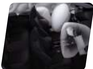
Sistema de control de frenado ABS con EBD y BA