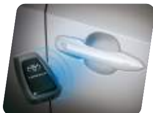
Apertura eléctrica de puertas