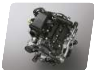
Motor 1.5L Dual VVT-i / 101.9 hp