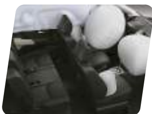
Airbags: piloto, copiloto, laterales y cortinas