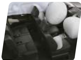
Airbags: piloto, copiloto, laterales y cortinas