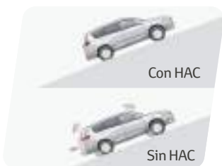
Asistente de partida en pendientes (HAC)