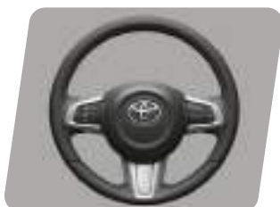
Timón de uretano con controles de audio