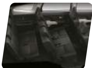
3 filas de asientos para 7 personas