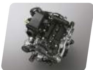
Motor 1.5L Dual VVT-i/ 101.9 hp