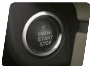
Engine Start (Encendido por botón)