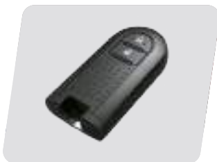
Smart Entry (Apertura de puertas a distancia)