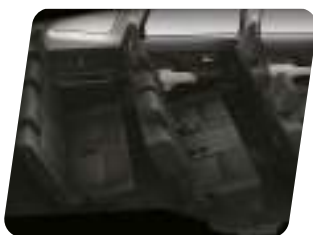
3 filas de asientos para 7 personas