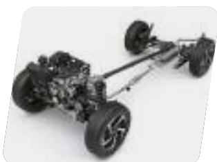
Disposición FR: motor adelante y tracción posterior