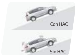
Asistente de partida en pendientes (HAC)