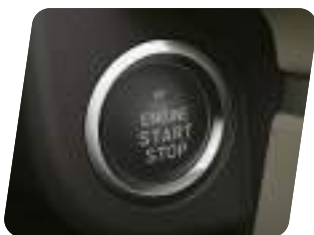
Engine Start (Encendido por botón)