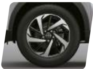
Aros de aleación bitono de 17"